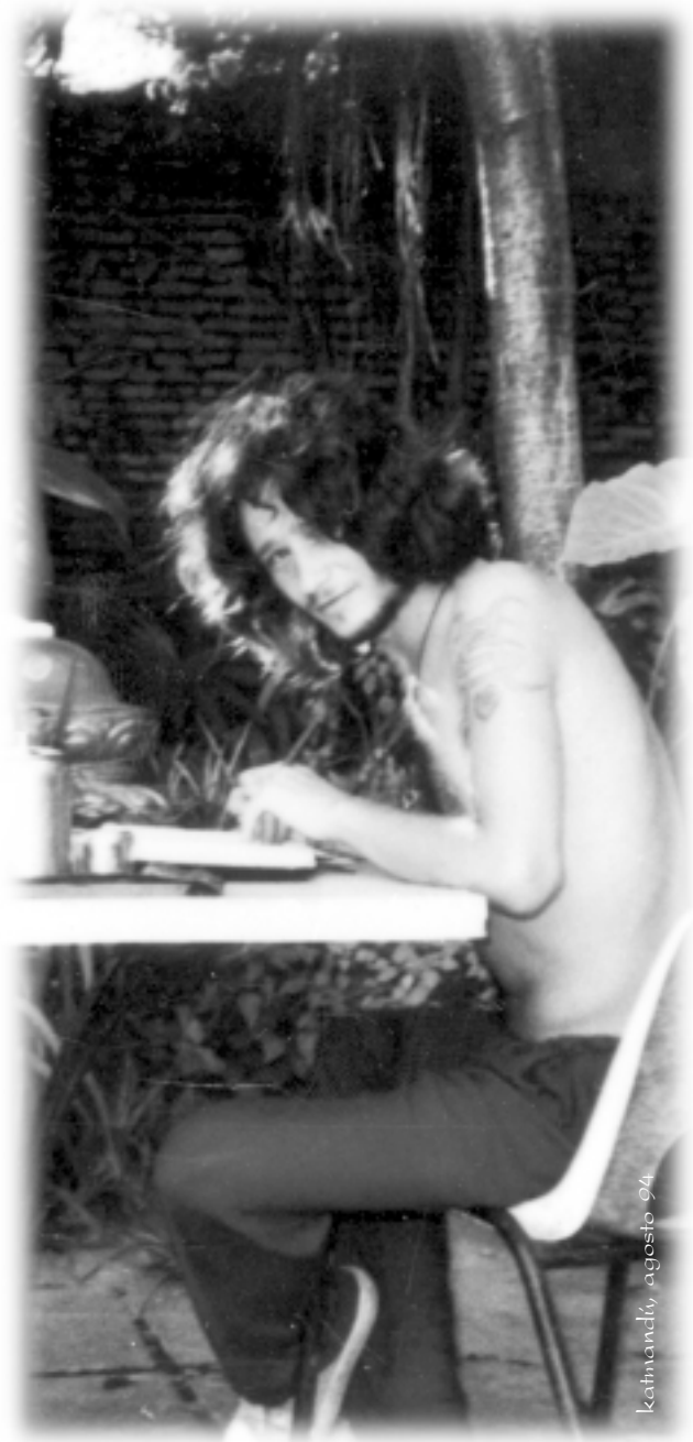
katmandú, agosto 94